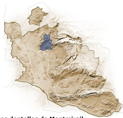
Les dentelles de Montmirail

La formation géologique des Dentelles est exceptionnelle : un pli diapire rare au monde. Les couches du Trias ont été fortement serrées, formant une "extrusion". Ces formations du début du Secondaire sont les plus anciennes du département ; elles comprennent différents faciès, tel des lentilles de gypse exploitées à Beaumes-de-Venise. La morphologie des Dentelles de Gigondas correspond aux calcaires massifs du jurassique. Le soulèvement des Dentelles se poursuit de nos jours et le lit de l'Ouvèze tend à se rapprocher et à creuser au