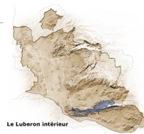
Le Luberon intérieur

Cette entité concerne plusieurs espaces distincts : - les "hautes plaines" du Luberon situées entre 600 et 1100 mètres d'altitude ; - les "craus" du Petit Luberon : petits plateaux calcaires dominant la Durance de 300 mètres : Crau des Mayorques, de Saint-Phalès, des Plaines ; - les gorges entaillant le massif, en particulier celle de l'Aiguebrun qui marque la rupture entre Petit et Grand Luberon ; - le plateau des Claparèdes adossé au versant Nord du Luberon, qui domine le bassin d'Apt à 500-700 mètres d'altitude. Ces paysages ne sont pas perçus de loin : il faut pénétrer le massif pour les découvrir.