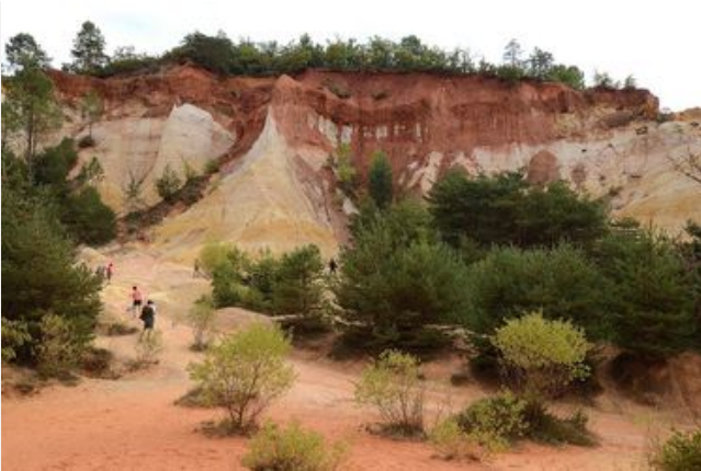
Les collines du Pays d'Apt