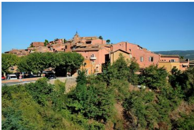
Les enjeux paysagers du Pays du Calavon