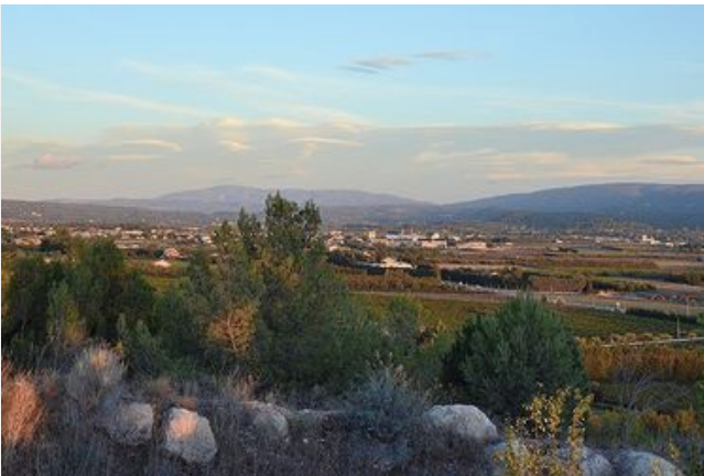
La plaine du Coulon