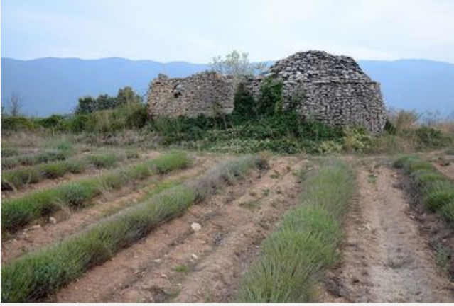
Le haut Calavon