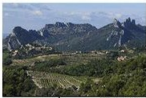
LE COL DU CAYRON - D. BOUTIER

Boisements : chênes verts, blancs et pins arbigues. Quelques hêtres constituent les survestiges de l'exploitation ancienne de cette essence. Le pin d'Alpe a gagné sur les zones agricoles, des défrichements importants ont touché de l'impact paysager et des remédier, 3 384 ha ont été restaurés (la forêt classée).