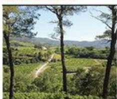
DE VILLE LA PONT DE ROSSIGNOL - LAMOTTE

Les routes qui permettent de découvrir le massif sont discrètes, avec un profil très simple. Lorsque la pente est forte, un muret de pierre marque le bord de route. Elles offrent des points de vue lointains comme au col de Suzette.