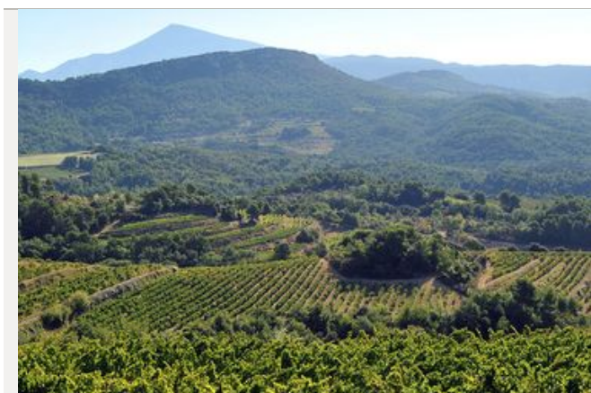
Enjeux paysagers des dentelles de Montmirail