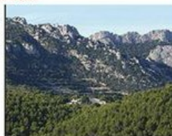
LE GRAND BOUTIRAS - D. BOUTIER

Ce bâti traditionnel a été entraîné par des constructions neuves relativement nombreuses. Implantées sur les pentes, sur des remblais très marqués, elles se donnent à voir de loin.