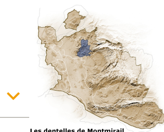
Les dentelles de Montmirail