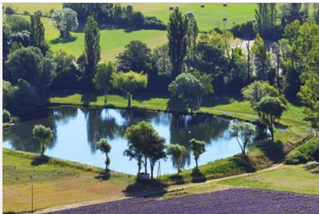
Enjeux paysagers des Monts de Vaucluse