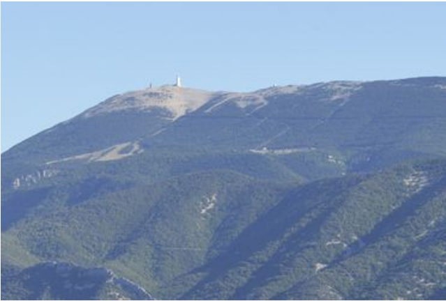
Le Mont Ventoux

Par son origine (la première émotion paysagère de Pétrarque au Ventoux puis les peintres au XVI e siècle qui en inventèrent le nom), le paysage est d'abord un concept culturel. Il échappe fréquemment aux considérations scientifiques pour puiser dans l'imaginaire individuel ou collectif, où il prend forme d'emblème : la représentation d'une idée, d'un SENS. C'est là un phénomène éminemment subjectif lié aux référents, à la sensibilité de chaque individu. Parmi ces référents, les émotions transmises par nombre d'artistes : peintres, écrivains et toutes sortes d'inspirés du paysage comme les poètes, les paysans, les géographes et beaucoup d'autres, qui nous amènent à voir les choses différemment. Cela confirme, comme dit Giono : "qu'on ne peut pas connaître un pays par la simple science géographique. On ne peut, je crois, rien connaître par la science ; c'est un instrument trop exact et trop dur" (in : L'eau vive, 1943).