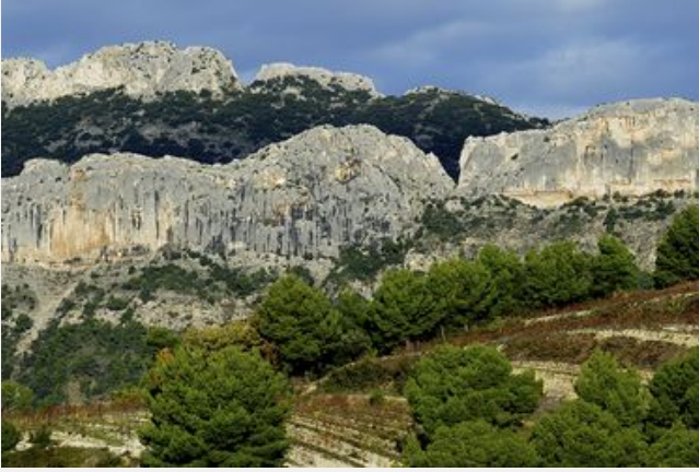
Les Dentelles de Montmirail