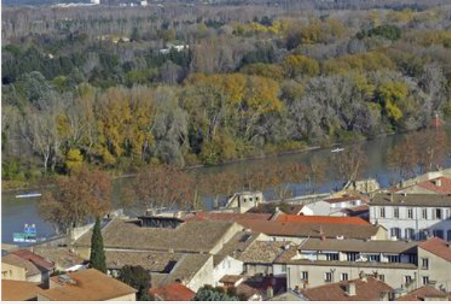
Le Rhône et Avignon